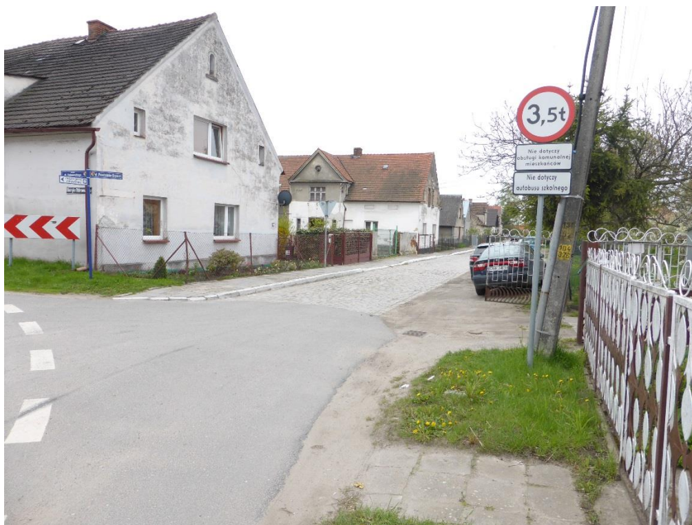
Fot. 3. Połączenie ul. Powstańców Śl. z ul. Gen. H. Dąbrowskiego (widok z drogi głównej) oraz zjazd na posesję przy ul. Powstańców Śl. 10 (o nawierzchni gruntowej).