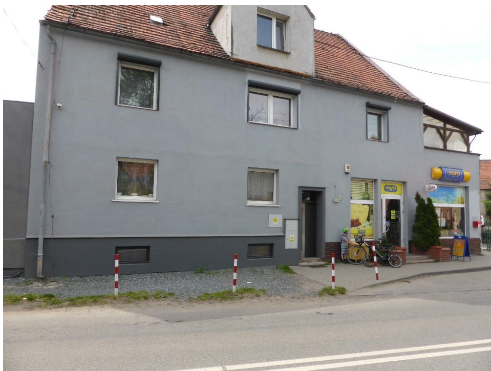
Fot. 1. Zakończenie istniejącego chodnika (o nawierzchni z kostki betonowej) w pasie drogi powiatowej nr 1945 D na wysokości posesji przy ul. Powstańców Śl. 4.