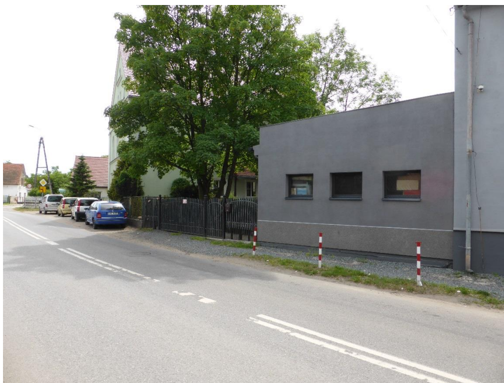
Fot. 2. Fragment drogi powiatowej nr 1945 D (ul. Powstańców Śl.) bez chodnika.